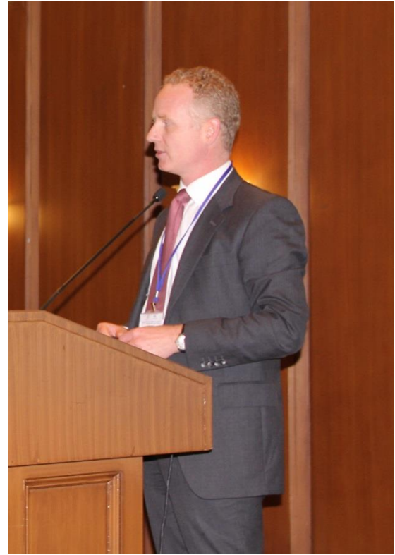
Geoffrey Davies , Çözümleme Politikaları Bölümü Başkanı, Bank of England, İngiltere